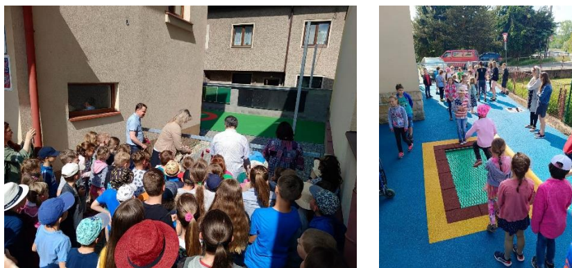
Hřiště za školní družinou

Rozsáhlejší fotodokumentaci ze školních i třídních akcí je možné zhlédnout v kategorii fotogalerie školního webu: http://www.skolalhota.cz/