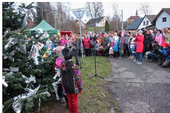
Rozsvěcení stromečku na lhotecké návsi