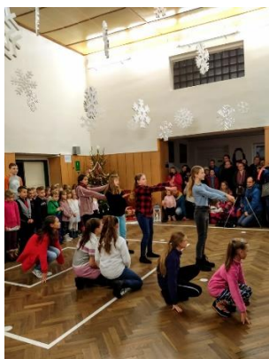
Vánoční kulturní představení